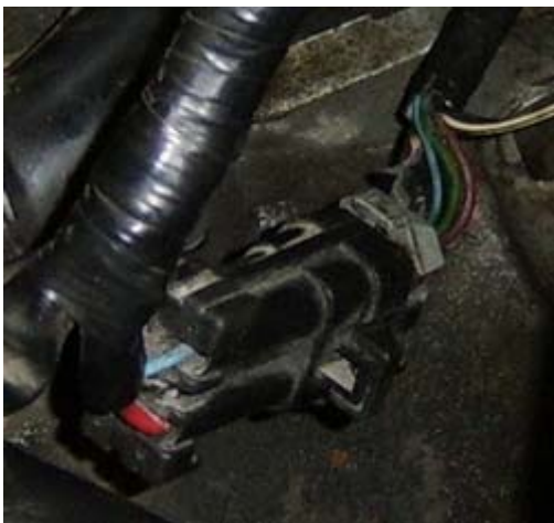
Stecker X19 – Kadett E C20XE ( muss nicht bearbeitet werden - Motorraum)