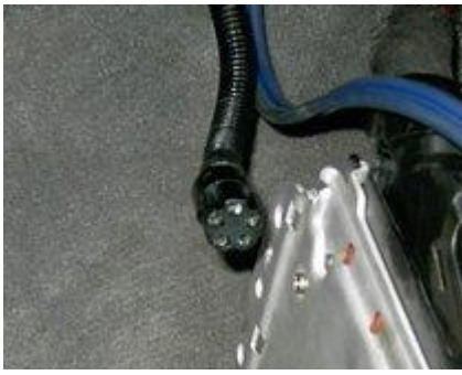
Stecker X11 – Kadett E C16NZ (neben Steuerteil)