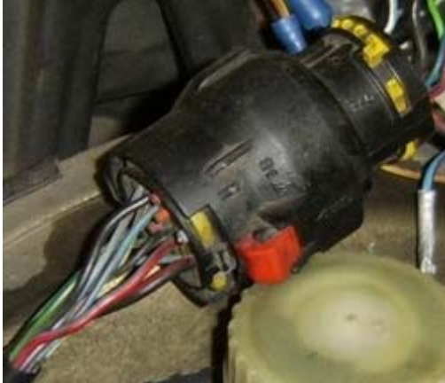
Stecker X5 – Kadett E C18NZ und C20NE