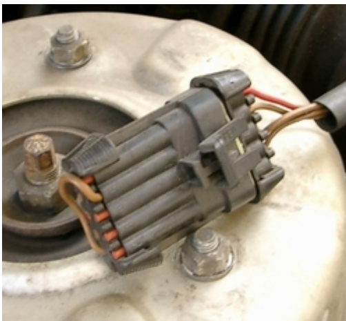
Diagnosesteckerkappe mit Überbrückung PIN G und PIN A