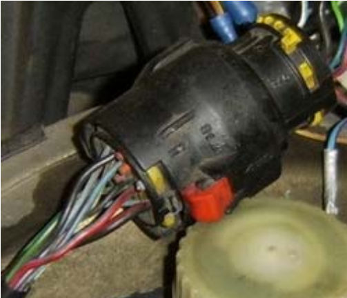
Stecker X5 – Calibra / Vectra A C20XE (Motorraum)