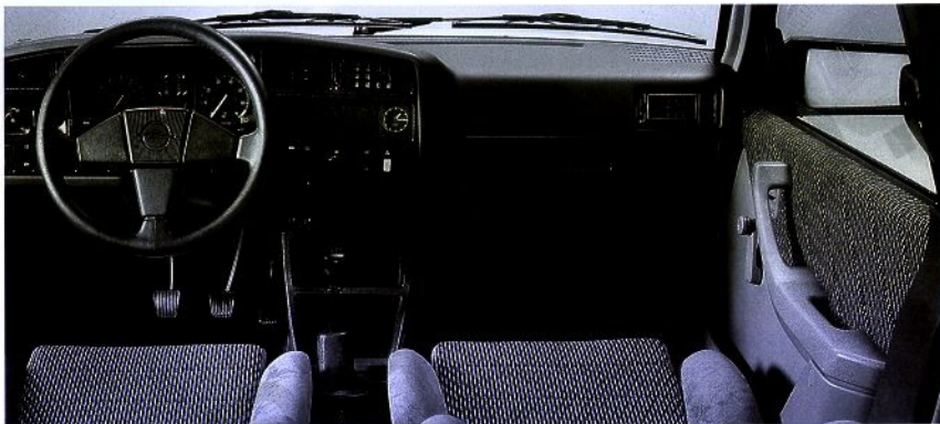
Das ganz auf Sportlichkeit ausgerichtete Interieur: Funktionalität und Aesthetik ohne Kompromisse. Damit sind dem Fahrvergnügen keine Grenzen gesetzt.

Der neue Ascona sprint ist ein sportliches Ereignis. Er weist wirklich überdurchschnittliche Stärken auf. Sein von modernster Motronic gesteuerter 2.0i Einspritzmotor bringt 115 PS/85 kW auf die Räder und zeichnet sich im gesamten Drehzahlbereich durch vorbildliche Elastizität aus – bei erstaunlich niedrigem Verbrauch. Zu seinem sportlichen Charakter passen Frontantrieb und 5-Gang-Sportgetriebe (Automat auf Wunsch). Seinem legendären Ruf als Fahrerauto wird er durch die attraktive "sprint"-Ausrüstung noch mehr gerecht: Sportsitze mit speziellen Polsterstoffen, Leder-Lenkrad, Leichtmetall-Felgen, Breitreifen 195/60 HR 14 und "sprint"-Beschriftung sind nur einige seiner temperamentvollen Merkmale. Mehr über die Ausrüstung erfahren Sie auf der letzten Seite. Den Ascona sprint gibt es mit Fließ- oder Stufenheck.