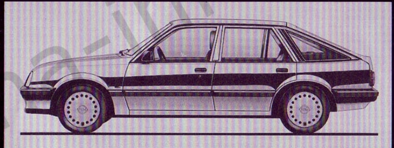
Fließheck oder Stufenheck.

Als Fließ- oder Stufenheck, der Ascona 2.0i Jubilé bietet Ihnen viel Kraft und eine umfangreiche Zusatzausrüstung zum günstigen Jubiläums-Preis. Und mit seinem eleganten «Jubilé»-Schriftzug sieht er noch exklusiver aus. Feiern Sie mit!