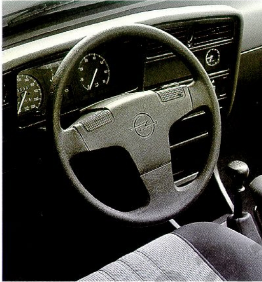
Die klare und übersichtliche Anordnung der Instrumente dient der Sicherheit, damit Sie sich beim Fahren auf das Wesentliche konzentrieren können.

Der neue Ascona exclusive überzeugt nicht nur durch seinen erstaunlich günstigen Preis sondern ebenso durch seine überdurchschnittlich reichhaltige Serienausstattung. Dynamischer 2.0i Einspritzmotor mit 115 PS/85 kW, Frontantrieb und 5-Gang-Getriebe (Automat auf Wunsch). Niveau und Klasse kennzeichnen den Ascona exclusive als ein Auto für den anspruchsvollen Fahrer. Veloursbezogene Sitze, elektrische Fensterheber vorn, 3 Speichen Komfort-Lenkrad sind ebenso selbstverständlich wie Zentralverriegelung und Stahlgürtelreifen 185/70. Und für zusätzliche Individualität sorgen diskret die «exclusive»-Beschriftung und der Dekorstreifen. Beim Fließheck und beim Stufenheck, welchem auch immer Sie den Vorzug geben. Mehr über die Ausrüstung erfahren Sie auf der letzten Seite.