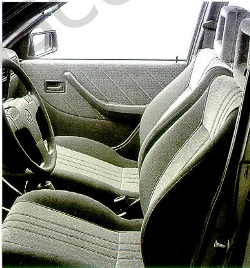
Die veloursbezogenen Sitze bieten besten Seitenhalt und tragen zum hohen Reisekomfort des Ascona exclusive bei.