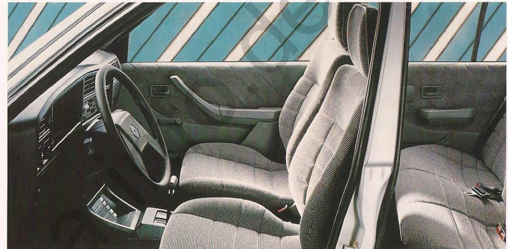
Cassettenbox und Automatic sind Sonderausstattung.