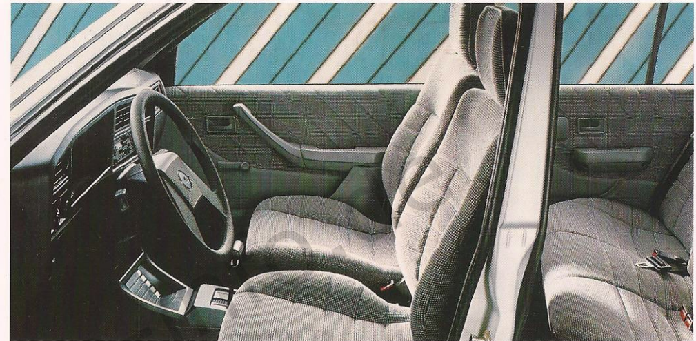
Cassettenbox und Automatic sind Sonderausstattung.