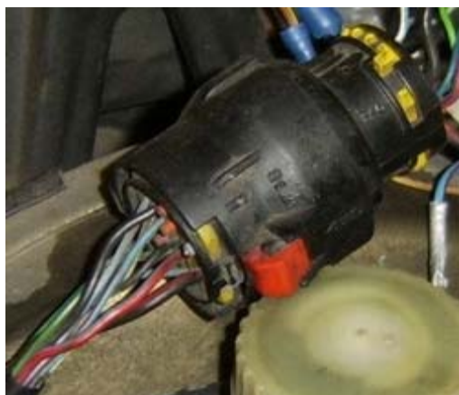
Stecker X5 – Kadett E C20NE