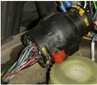
Stecker X5 – Astra F C20XE (Motorraum)