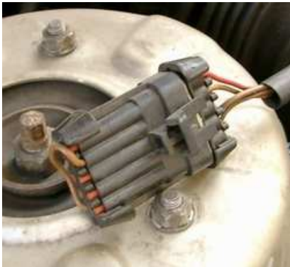
Diagnosestecker X13: Kappe mit Überbrückung PIN G und PIN A