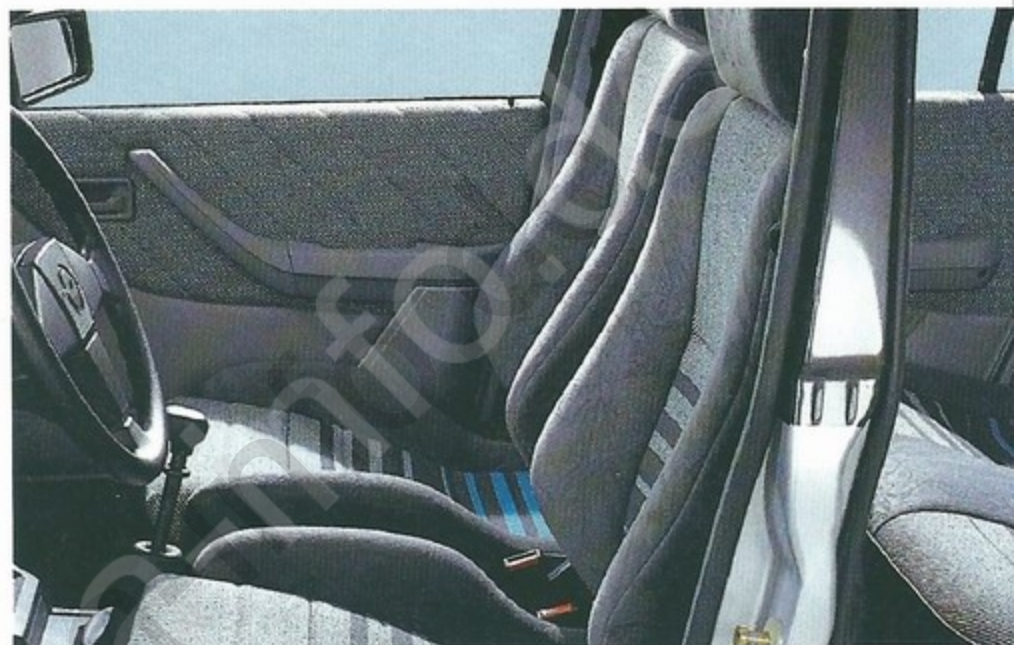
Ascona GT Interieur

Der Ascona GT hat ein speziell abgestimmtes Fahrwerk mit Gasdruckstoßdämpfern und ein wirtschaftliches 5-Gang-Getriebe. Serienmäßig der 1.6 S-Motor 60 kW (82 PS) oder als Sonderausstattung die 2.0 i-Triebwerke.