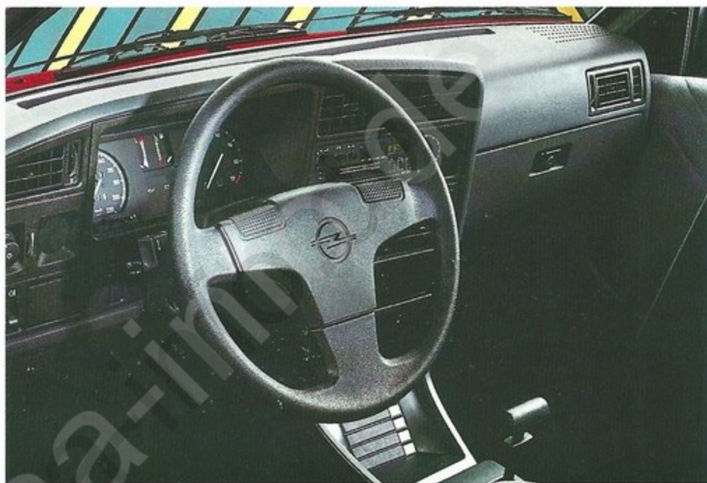
Ascona GLS Cockpit

Der neue Ascona – ein Plus an Technik, Optik und Komfort.